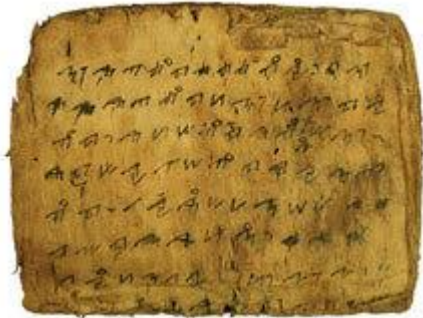
*Prasasti tulisan Rencong

Namun Maharaja Srivijaya mengenakan cukai ke atas pelabuhan-pelabuhan Nusantara menjadikan Srivijaya antara empayar terkaya di Timur Jauh. Ini ada dalam catatan pengembara Cina dan Arab. Malah Empayar Srivijaya pernah menggunakan matawang emas sebagai transaksi perdagangan.